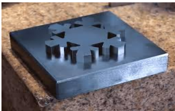
Fig. 1.1. Exemplu de figură

• Relațiile de calcul se scriu cu editoare specifice (Equation) și se numerotează la dreapta. Numerotarea acestora va cuprinde numărul capitolului, urmat de numărul de ordine al relației în cadrul capitolului;