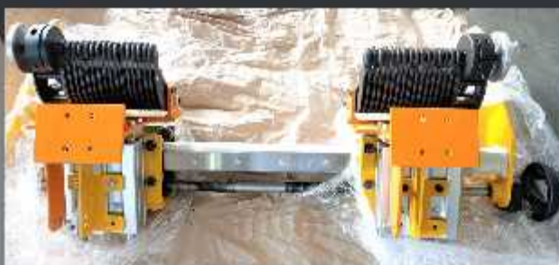
Ansamblu pneumatic piano