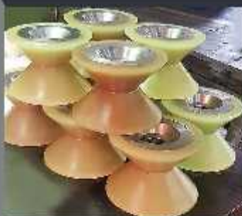
Roți acoperite cu poliuretan 70 shori