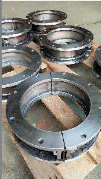
Inele de legătură