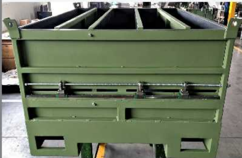
Container cu pereți despărțitori mobili