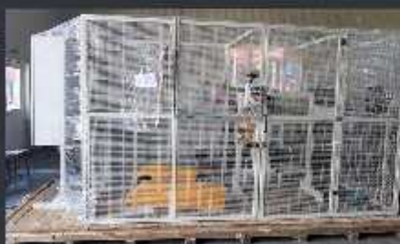
Hometrainer assy - e ectric, pneumatic