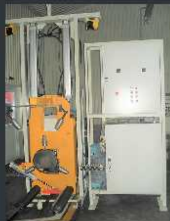
Stație PVB - du ap electric