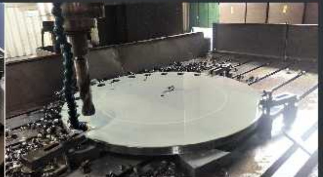
Execuție flanșă cu diametrul de 1200mm