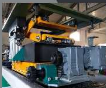
Ansamblu conjuncto - pneumatic, electric