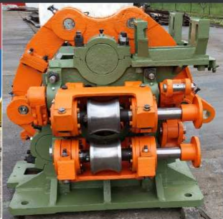
Linetă 5.5 tone înainte și după reparație