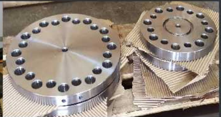
Flanșe cu scobitură pentru garnitură și găuri de prindere