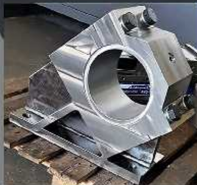
Lagăr cu alezaj 200mm