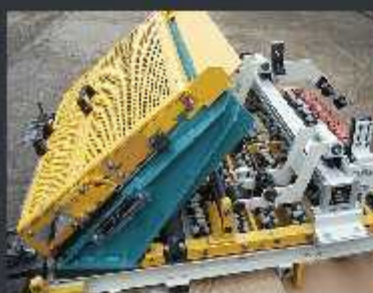
Post PS -acționare pneumatică, electrică