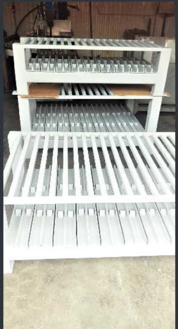
Raft metalic pentru flanșe