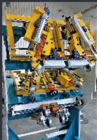
Ansamblu pneumatic Rabateuse

- proiectare și execuție după necesitățile clientului / execuție după documentația clientului.