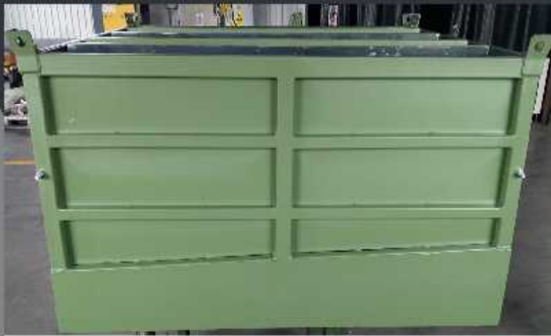
Container cu pereți despărțitori mobili