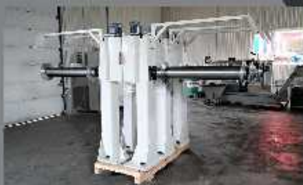
Ansamblu rolă motorizată - electric