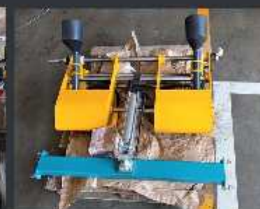
Dispozitiv pneumatic steartare